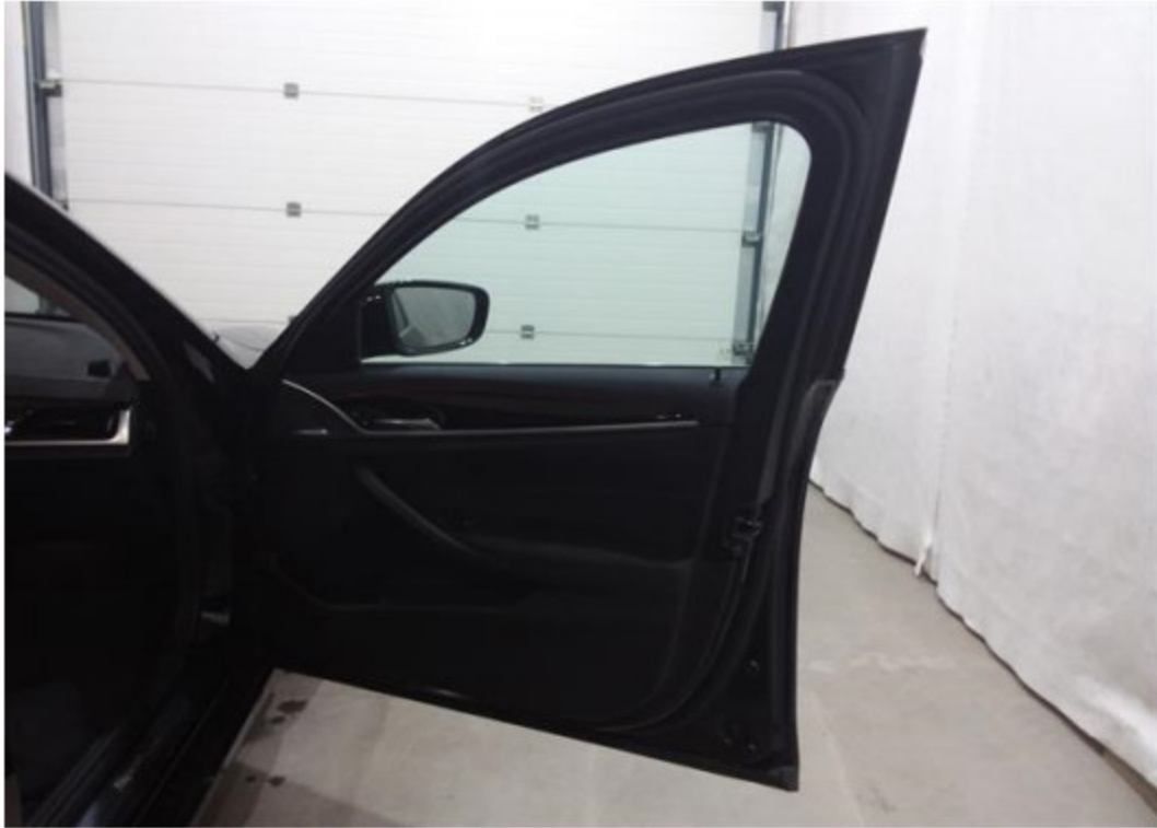
Dveře spolujezdce vnitřní část