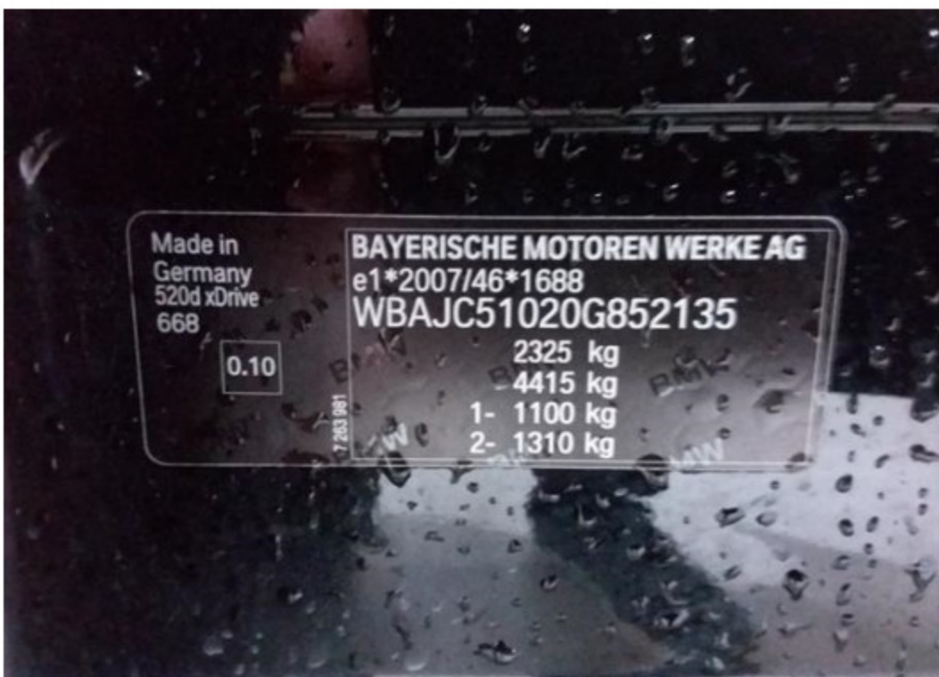
Foto VIN 2