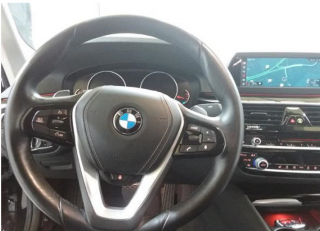
Palubní deska od řidiče