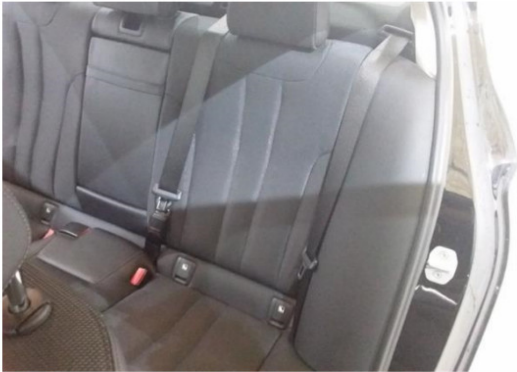
Zadní levé sedadlo