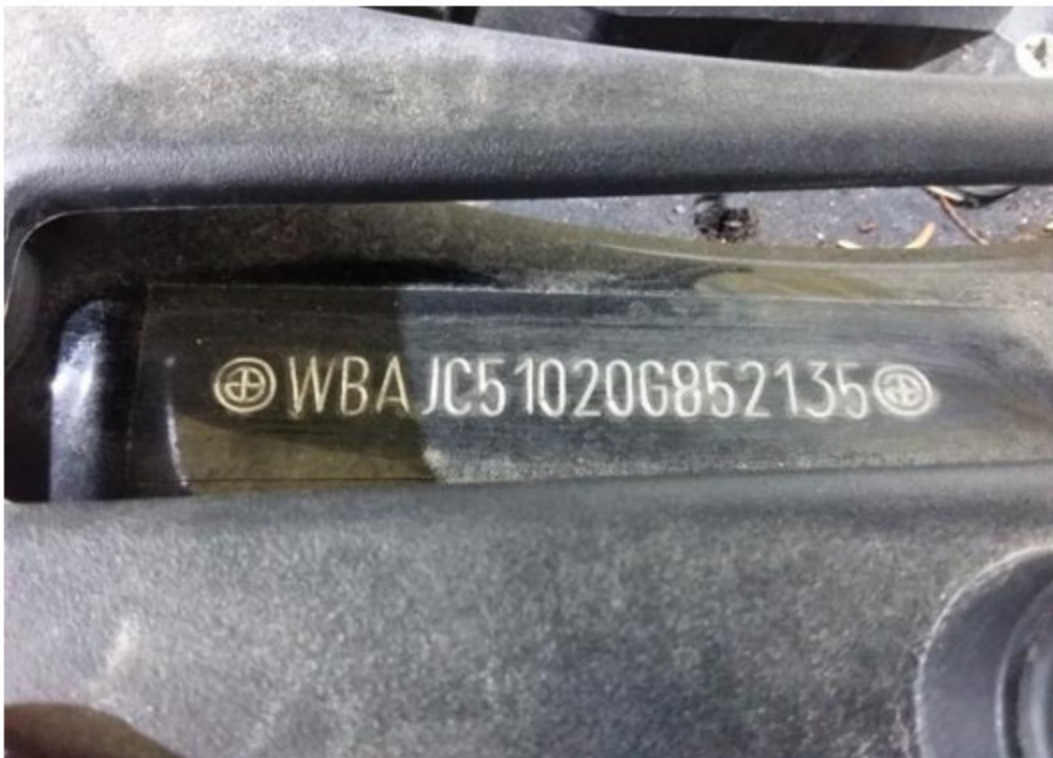
Foto VIN 1