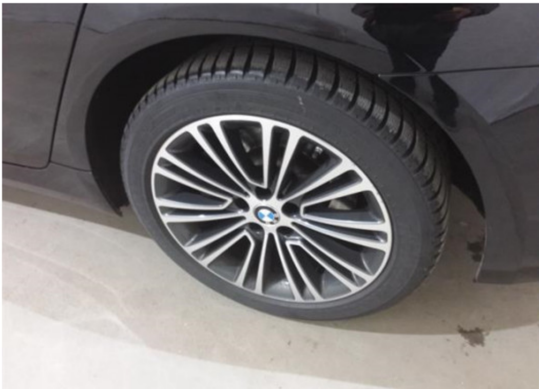
Viz popis k poškození č. 4