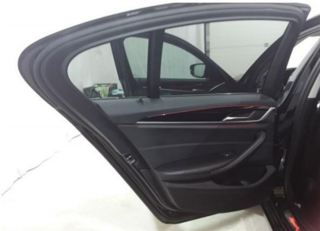
Zadní levé dveře vnitřní část