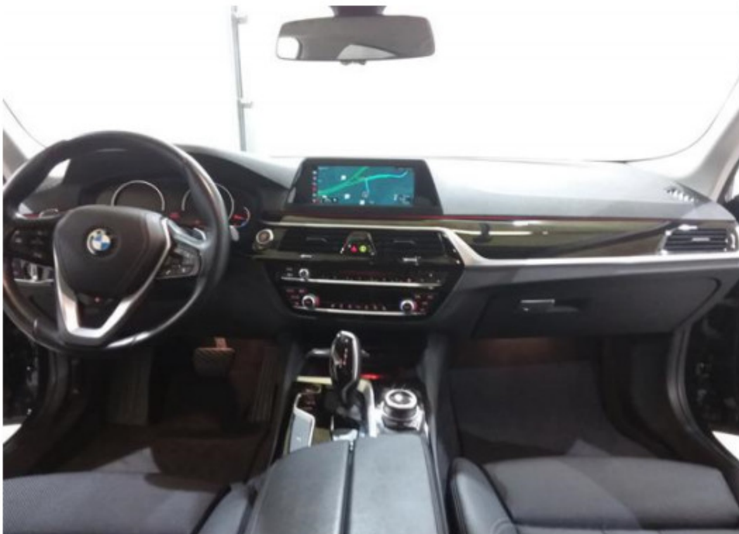
Palubní deska celá