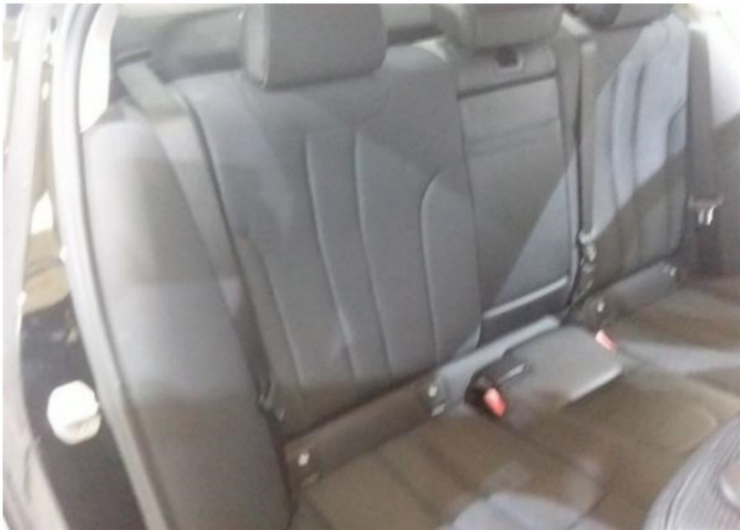
Zadní pravé sedadlo