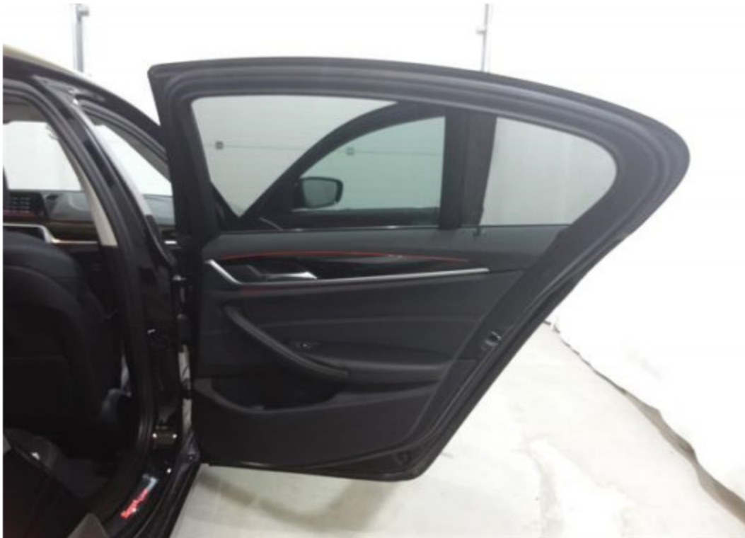
Zadní pravé dveře vnitřní část