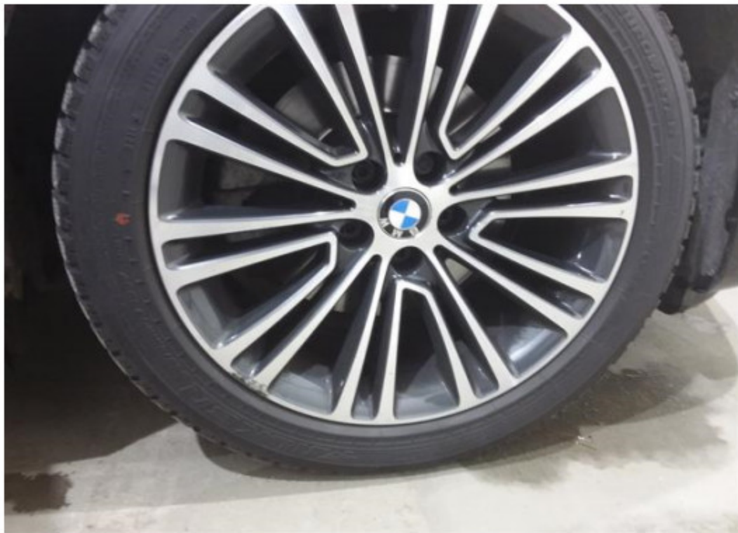
Viz popis k poškození č. 3