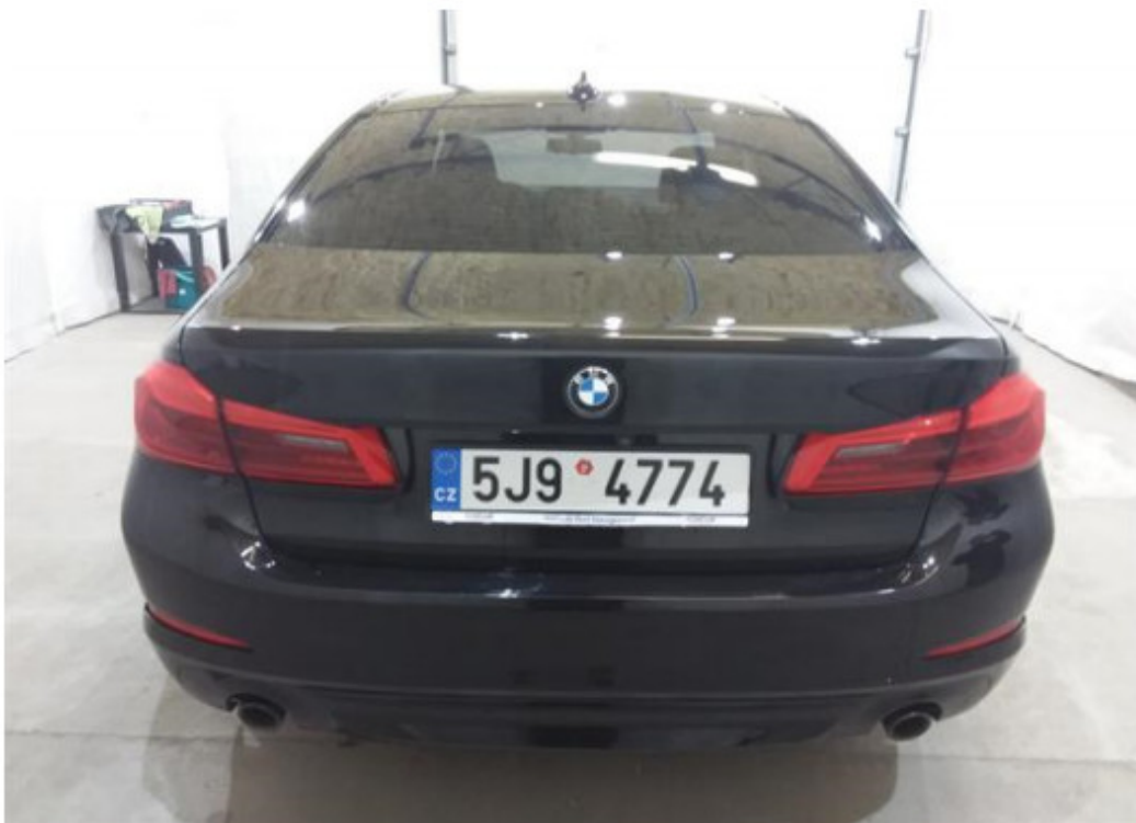
Zadní část vozu