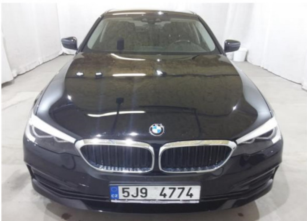
Přední část vozu