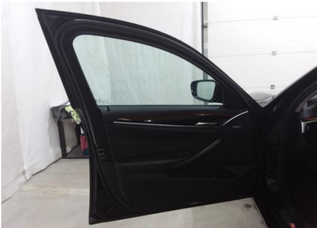
Dveře řidiče vnitřní část